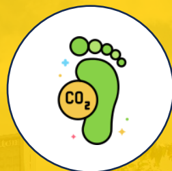
Gestión de Huella de Carbono