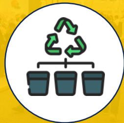
Gestión de residuos