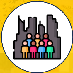
Relacionamiento con la comunidad