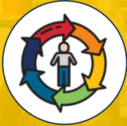
Gestión del Talento Humano