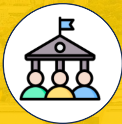
Ética y Transparencia Pilar Rector