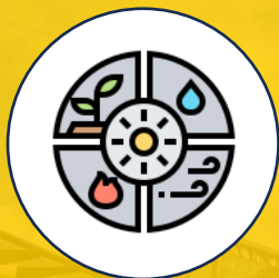
Gestión de recursos (agua, energía y papel)