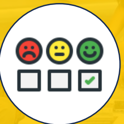
Satisfacción del Cliente

Promovemos la cultura local y nacional a través de eventos y su difusión en medios de comunicación