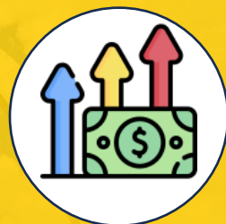
Cumplimiento de Metas Financieras